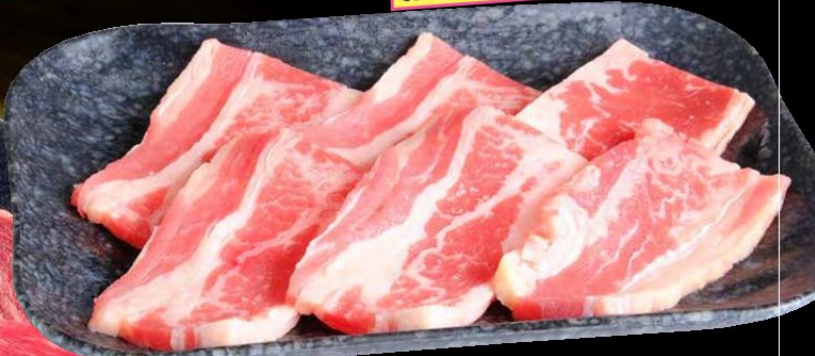
旨味牛カルビ 680円 税込 748円