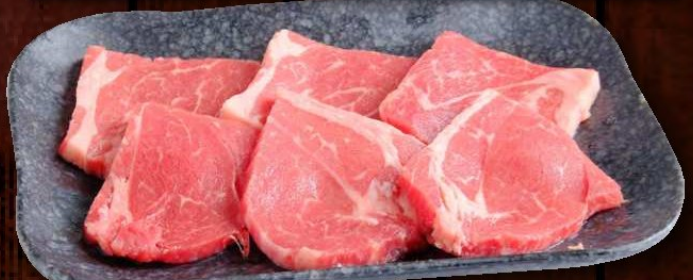
牛上ロース 780円 税込 858円