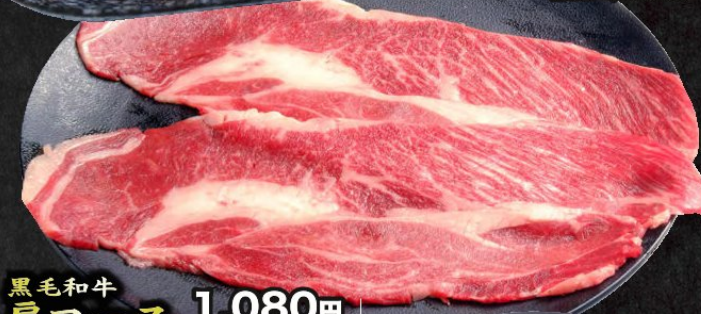
黒毛和牛肩ロース 1,080円 (税込1,188円)