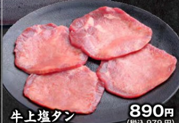
牛上塩タン 890円 (税込979円)