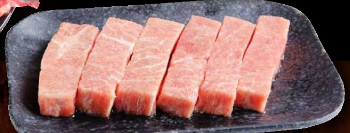
霜降ステーキ 780円 税込 858円