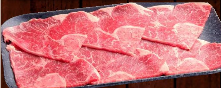
国産牛赤身うす切 780円 税込 858円