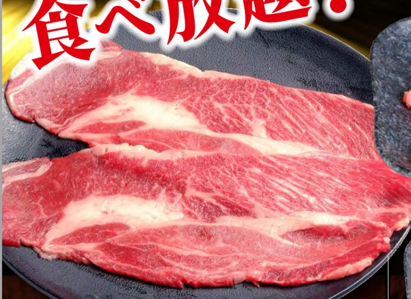
黒毛和牛肩ロース 1,080円 税込 1,188円