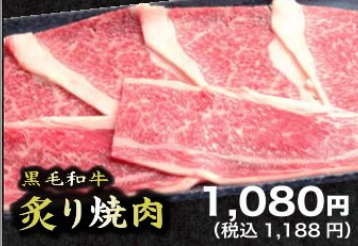
黒毛和牛炙り焼肉 1,080円 (税込1,188円)