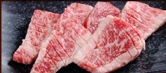
国産黒毛牛カルビ 880円 税込 968円