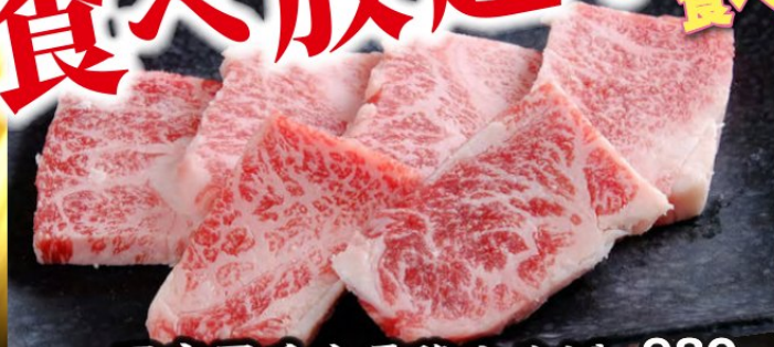
国産黒毛牛霜降カルビ 980円 (税込1,078円)