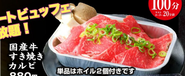
国産牛すき焼きカルビ 880円 (税込968円)