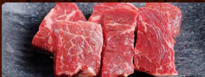
牛ハラミ 780円 税込 858円