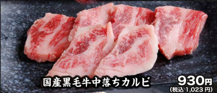
国産黒毛牛中落ちカルビ 930円 (税込1,023円)