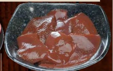
国産焼レバー 400円 (税込 440円)