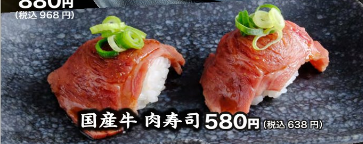
国産牛 肉寿司 580円 (税込638円)