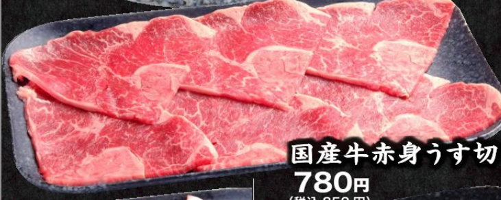
国産牛赤身うす切 780円 (税込858円)