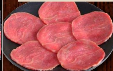
あっさり旨味牛タン 790円 (税込 869円)