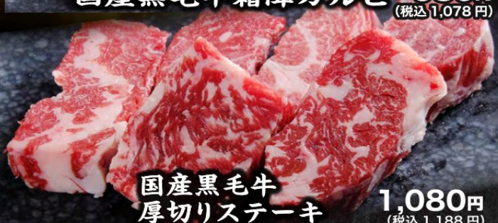
国産黒毛牛厚切りステーキ 1,080円 (税込1,188円)