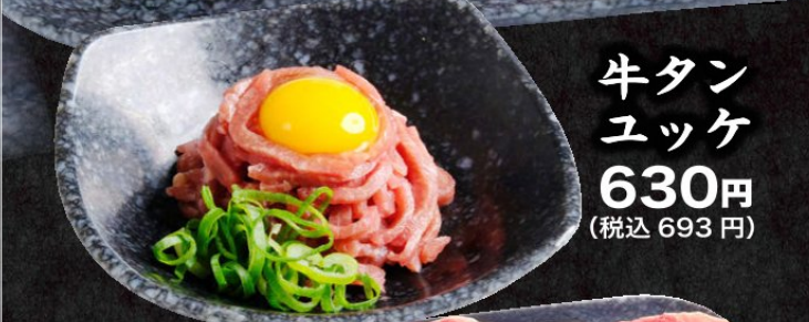
牛タンユッケ 630円 (税込693円)